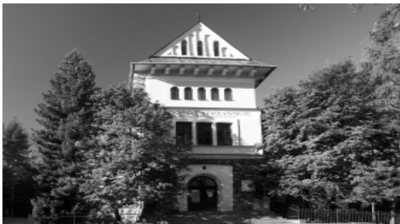
Gmach główny Muzeum Tatrzańkiego, fot. ze zbiorów Muzeum Tatrzańkiego.

Muzeum Tatrzańskie powstało w 1888 r. i należy do najstarszych i największych muzeów regionalnych w Polsce. Jest placówką wielodziałową z głównymi działami kolekcjonerskimi - przyrodniczym, etnograficznym i sztuki oraz ze specjalistyczną biblioteką i archiwum.