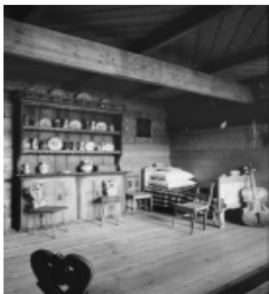
Fragment ekspozycji etnograficznej.

Szlak „muzeum przestrzennego” prowadzi także poza Zakopane. W etnograficznych wnętrzach Muzeum Powstania Choczołowskiego pokazano dzieje poruseństwa choczołowskiego z 1846 r. W Muzeum Kultury Szlacheckiej w Łopusznej, gdzie wystawa nie jest jeszcze ukończona, można zobaczyć dworską kuchnię oraz zabytkową chałupę Klamerusów i jej etnograficzne wnętrza.